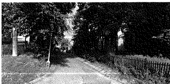
Stara Droga 2A 43-190 Mikołów