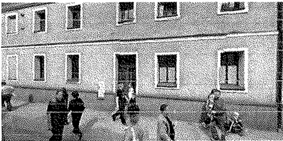
Jana Pawła II 1 43-190 Mikołów