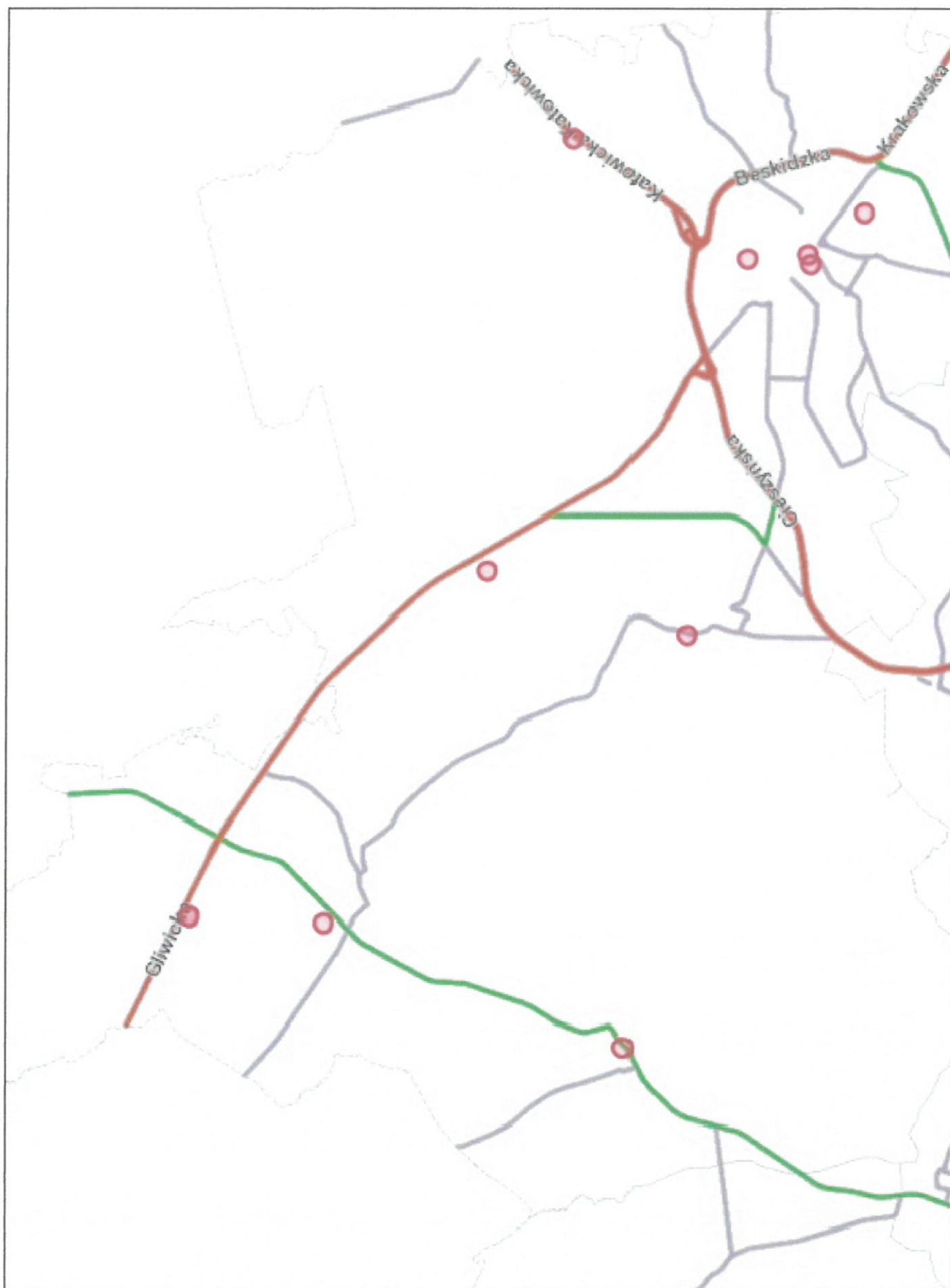
Załącznik nr: 4 Mapa Mikołowa z zaznaczonymi 10 lokalizacjami AED które obejmuje projekt.