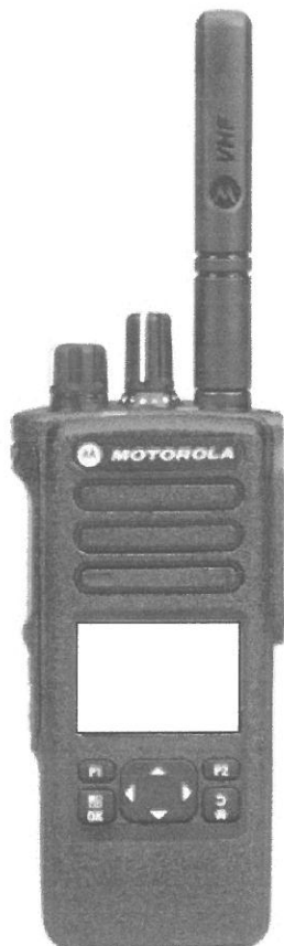
← Motorola DP4800e VHF