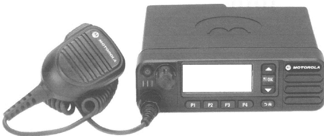
Motorola DM4600e VHF